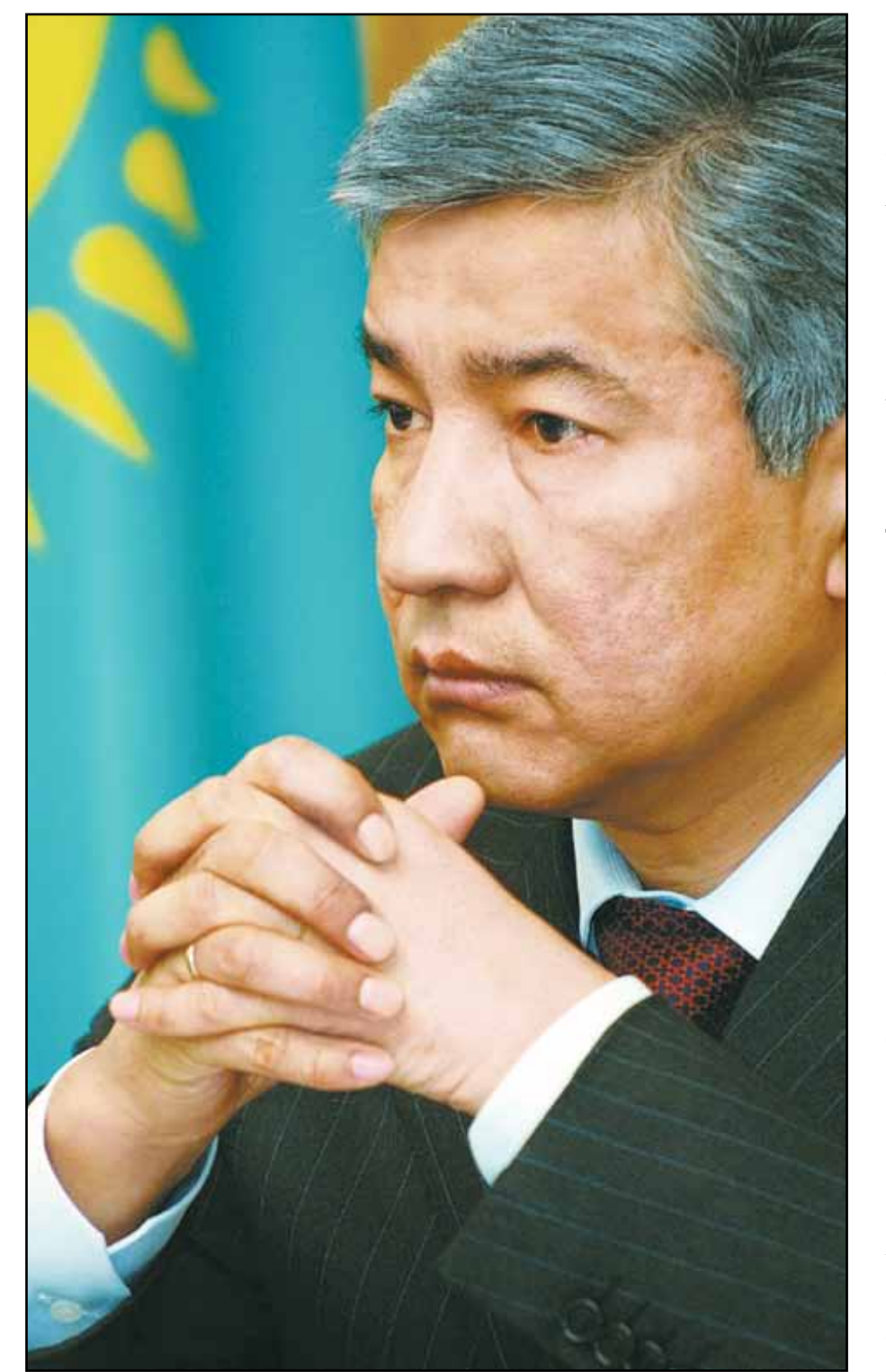
Среди них Армения, Россия, Беларусь, Грузия, Израиль, Индия, Китай, Кыргызстан, Таджикистан, Турция, Украина, Франция.

А уже в конце января 2016 года министр обороны договорился о продаже в Иорданию 50 казахстанских бронированных колесных машин «Ар-39» мн. 7625 мм, 915 мм, 915 мм, 915 мм. Запуск данного производства позволит Казахстану войти в число стран-производителей боеприпасов стрелкового вооружения на долговременный период. Уже сейчас АО «Каскенолин» ведет переговоры по экспорту продукции завода. Для обеспечения боеприпасами Вооруженных Сил Республики Казахстан будут применяться казахстанское сырье и материалы, что даст возможность быть независимым от стран-поставщиков.