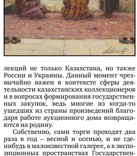
Здесь же располагается офис аукционного дома и, соответственно, отбор и оценка лотов происходит в тесном контакте с научными сотрудниками Кастееви. Это дорогостоящая работа, которая требует от организатора произведения высокого коллекционного качества и даже музейного уровня.