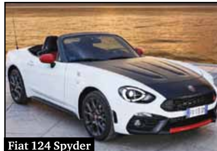
Fiat 124 Spyder