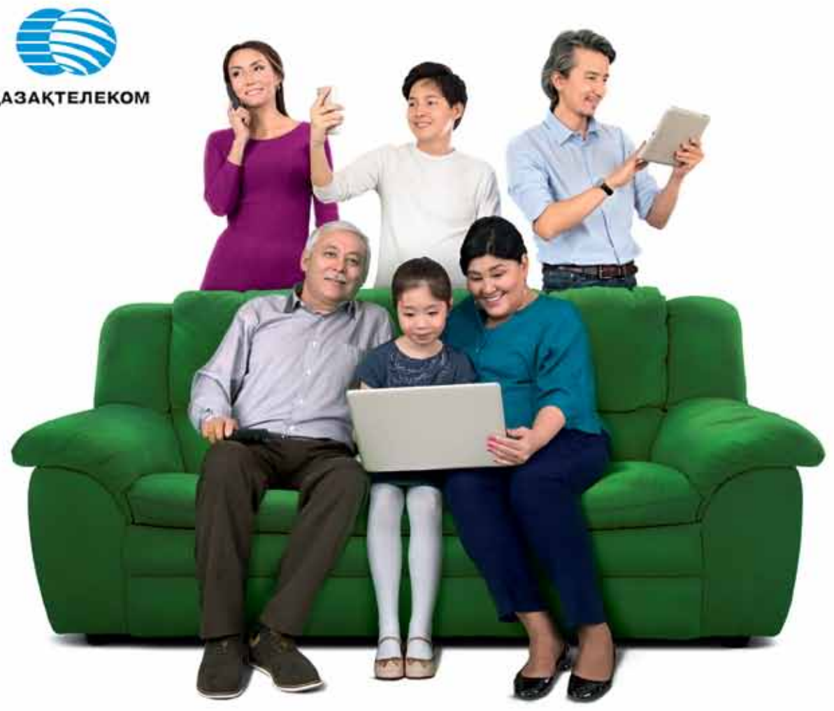
1614.09.10 № 14014826 «Иллюстрация Казахстана» Республикасы Инициативалары және даму министрлігінің Бюджетіне, акпараттар және ақпарат комитеті жанымен. "Қазтелком" АҚ телекоммуникация желілері пайдаланушы "ALACAST" ЖШС-нің КР МААМ 2012.22.11.