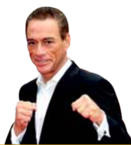
ЖАН-КЛОД ВАН ДАММ

ПРОМОКОД ДЛЯ ПОЛУЧЕНИЯ СКИДКИ 25% КРКZ01