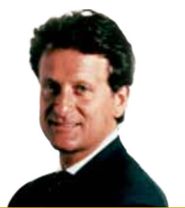
ЖАН ЛУИДЖИ ЛОНДЖИНОТТИ- БУИТОНИ