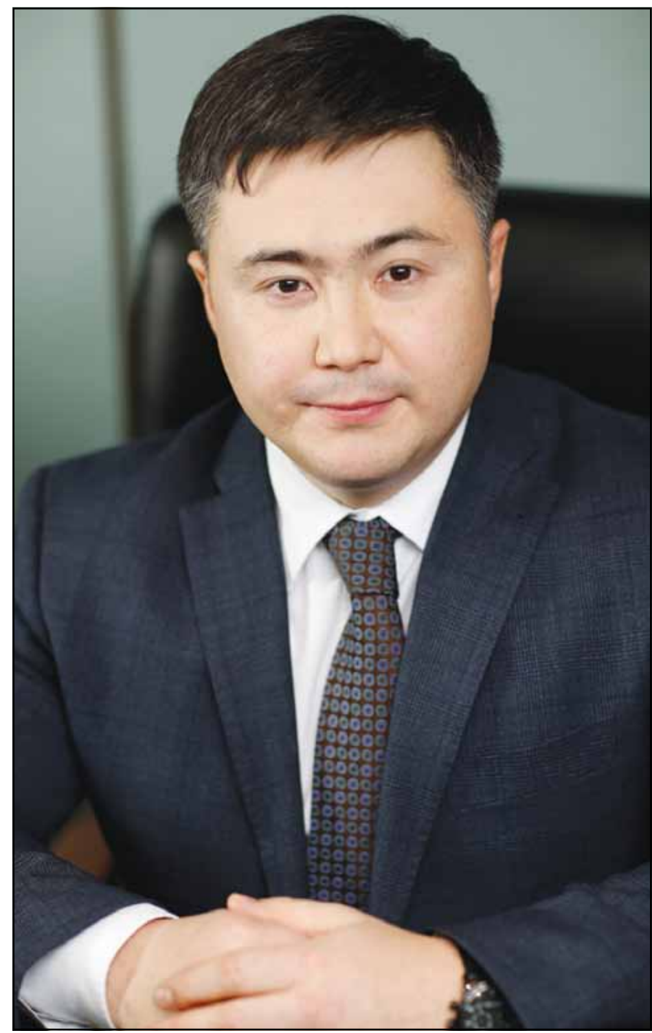
Тимур Сулейменов, министр по экономике и финансовой политике Евразийской экономической комиссии

— По алкоголю также нам было легче работать на три страны, потому что у нас сопоставимое экономическое развитие, располагаемые доходы и, соответственно, мы умеем друг с другом договариваться. По Армении и Казахстана несколько сложнее ситуация. Для них этот процесс новый, это дополнительные обязательства, но и экономическая ситуация там несколько более сложная, с такой же скоростью выравнивать акцизы они боится. Но мы проводим консултации, договорились, что на уровне пяти вице-премьеров будет отдельное совещание, щелчком и полностью посвященное этому вопросу.