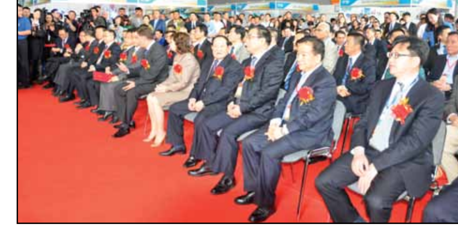
Форум торгово-экономического и инвестиционного сотрудничества между Китаем и Казахстаном

22 мая 2016 года в 10:00 в Доме приемов «Бакхасарай» (зал «Пушкин») состоится Форум торгово-экономического и инвестиционного сотрудничества между Китаем и Казахстаном.