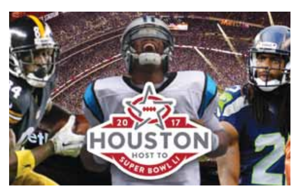
Американский футбол (Национальный лига)

С 29 марта по 2 апреля в столице Финляндии Хельсинки на «Хартвалл Арене» пройдет чемпионат мира по фигурному катанию. Денис Тен является единственным в истории этого вида спорта фигуристом из Казахстана, которому удалось завоевать награды на чемпионатах мира. В 2013 году он стал серебряным призером, а в 2015-м завоевал бронзу.