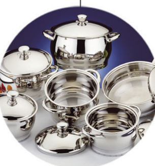
ТОВАРЫ ДЛЯ ДОМА - ПОСУДА, ТЕКСТИЛЬ