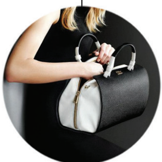
АКСЕССУАРЫ (ЧЕХЛЫ, СУМКИ, КОШЕЛЬКИ)