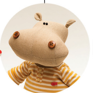
ИГРУШКИ РУЧНОЙ РАБОТЫ